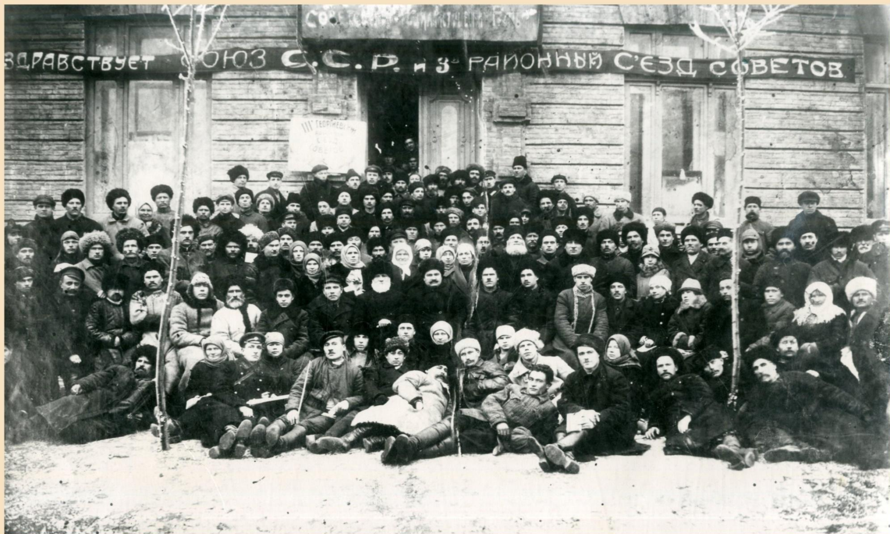
Делегаты III Георгиевского районного съезда советов. 1930 год.

Государственный архив Ставропольского края. 0-6117.