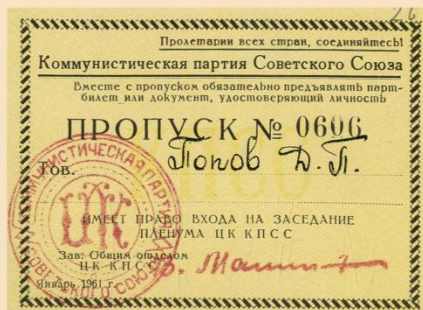
Пропуск Д.П. Попова для право входа на заседание пленума ЦК КПСС. Январь 1961 года.