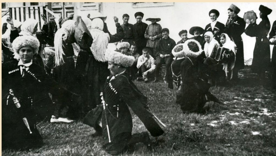
Выступление пионеров Карачаевского района перед избирателями во время выборов в Верховный Совет СССР. 1936 год.

Государственный архив Ставропольского края. 0-12028.