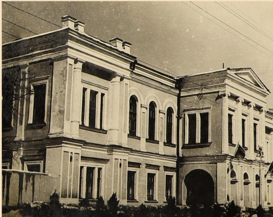
Здание Ставропольского горисполкома. 1961 год.

В 1962 году были учреждены районные исполкомы, подчиняющиеся исполкому Ставропольского городского Совета депутатов трудящихся. В 1965 году в крае проходили выборы в местные Советы депутатов трудящихся.