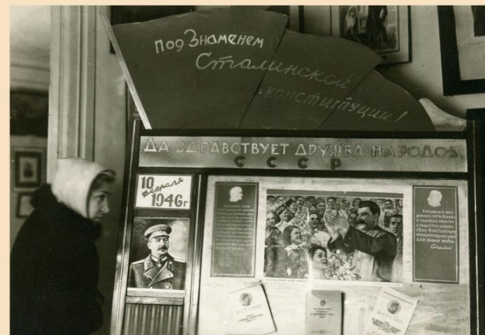
Агитационный стенд в музее "Домик Лермонтова". Первый послевоенные выборы в Верховный Совет СССР. 1946 год.

0-762.