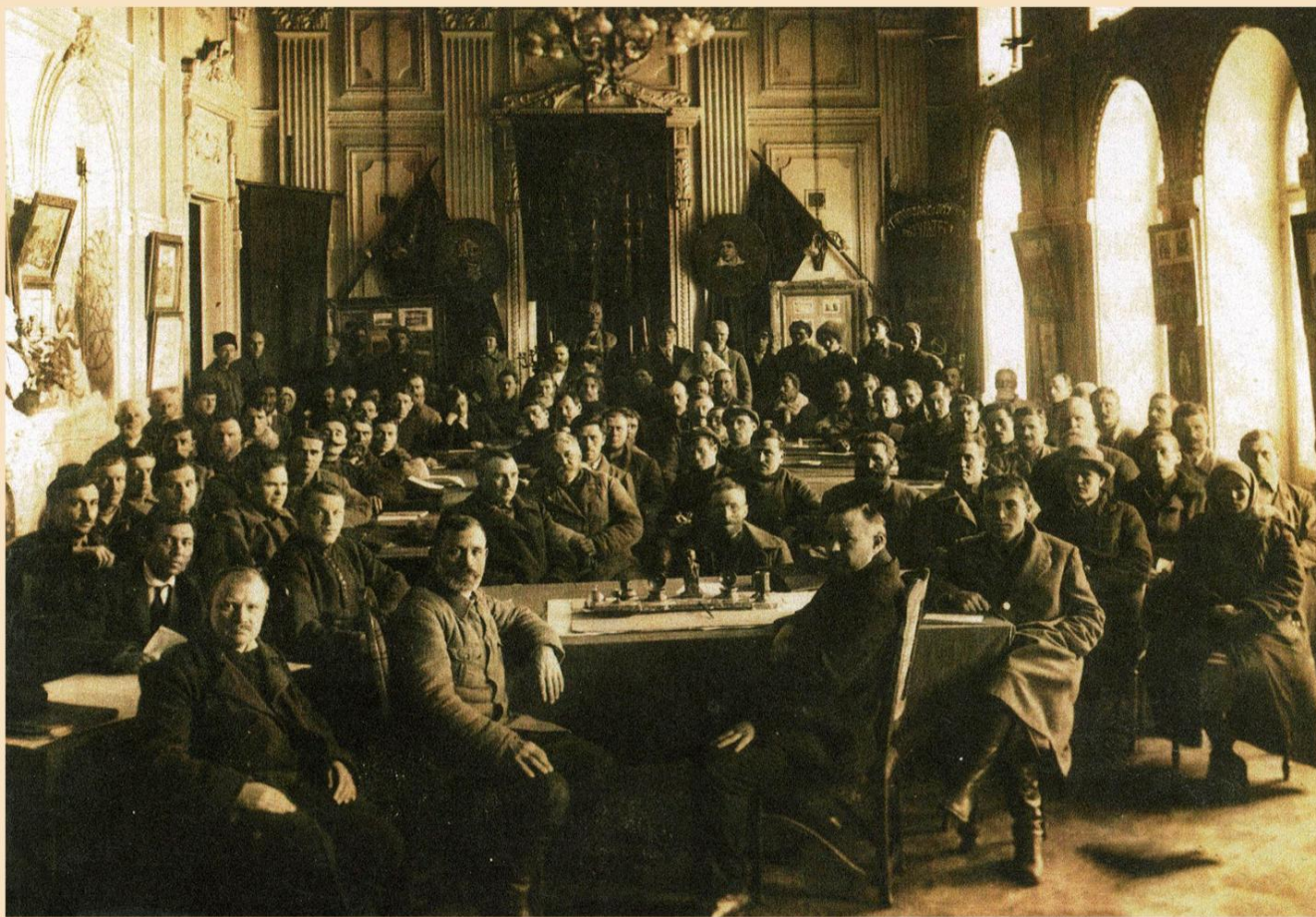
Собрание в зале заседаний бывшего Губернаторского дома. 1926 год.