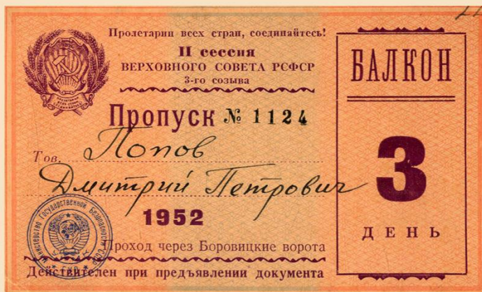
Пропуск Д.М. Попова на II-ю сессию Верховного Совета РСФСР 3-го созыва. 1952 год. Государственный архив Ставропольского края. Ф.Р-6246, оп.1, д.21, л.22.