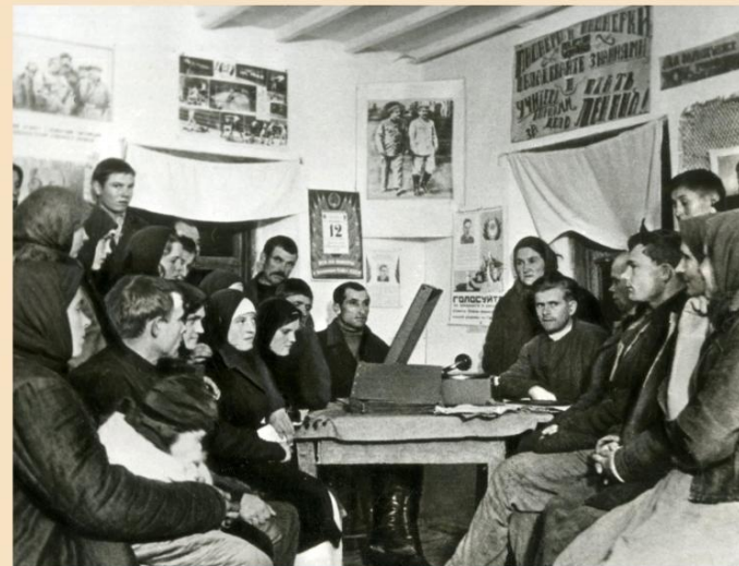
Колхозники Петровского р-на Орджоникидзевского края перед выборами в Верховный Совет СССР. Декабрь 1937 года.

Государственный архив Ставропольского края. 0-12028.