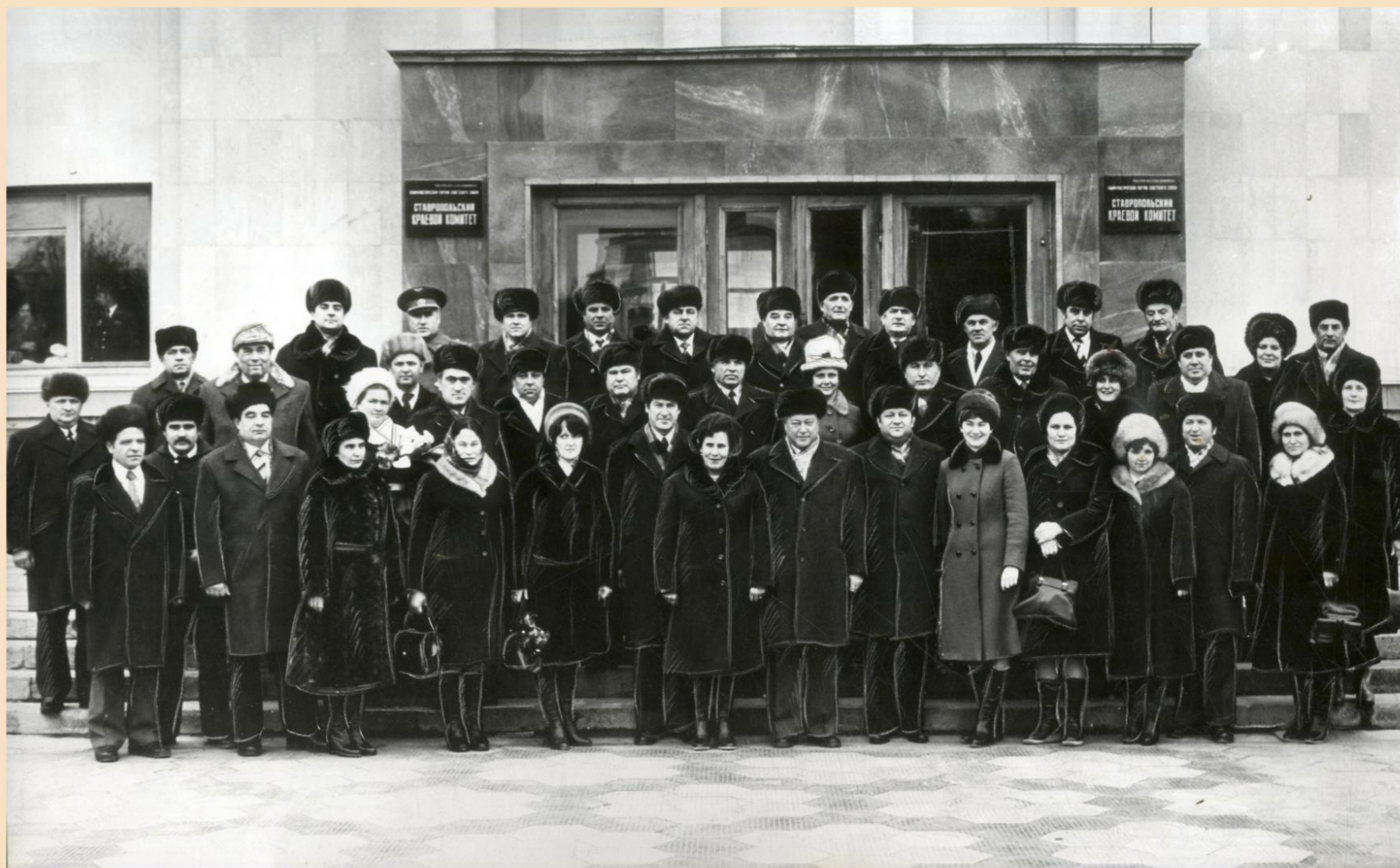
Группа делегатов XXVI съезда КПСС от Ставропольской краевой партийной организации у здания крайкома. 1981 год.

0-17114.