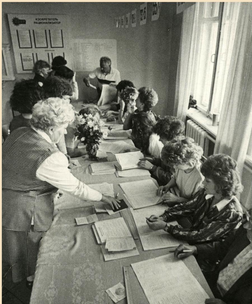
Работы одного из избирательных участков во время выборов Президента РСФСР. 1991 год. Государственный архив Ставропольского края. 0-20241.

17 марта 1991 года прошёл первый всероссийский референдум о введении поста Президента РСФСР. В нём приняло участие 75,09 % граждан РСФСР, из них 71,3 % поддержало это предложение. Через три месяца, 12 июня 1991 года, первым Президентом РСФСР был избран Борис Николаевич Ельцин.